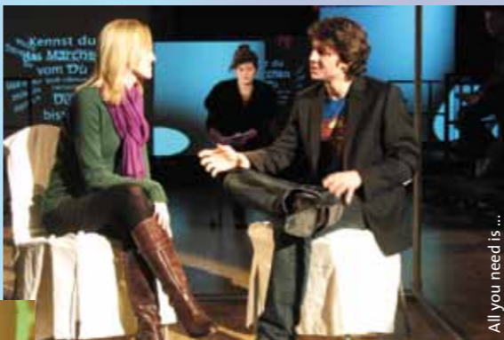
All you need is ...

Wie der Titel verrät, geht es um das große Thema „Liebe“. Im Hauptteil bringt das Stück eine spezielle Form der Partnersuche auf die Bühne: das „Speed-Dating“. Sieben Minuten Zeit haben die einander fremden Personen, sich gegenseitig abzuklopfen und das Glück einer möglichen Liebes-Konstellation einzuschätzen. Dieser, auf den ersten Blick platten Form der Liebe, stehen in dem Stück lyrische Ausdrucksformen gegenüber. Beide widerspiegeln die Innen- und Außenwelt der Figuren. In den lyrischen Eingangsszenen werden Texte von Lorca, Lessing oder Ingeborg Bachmann rezitiert. Die Figuren