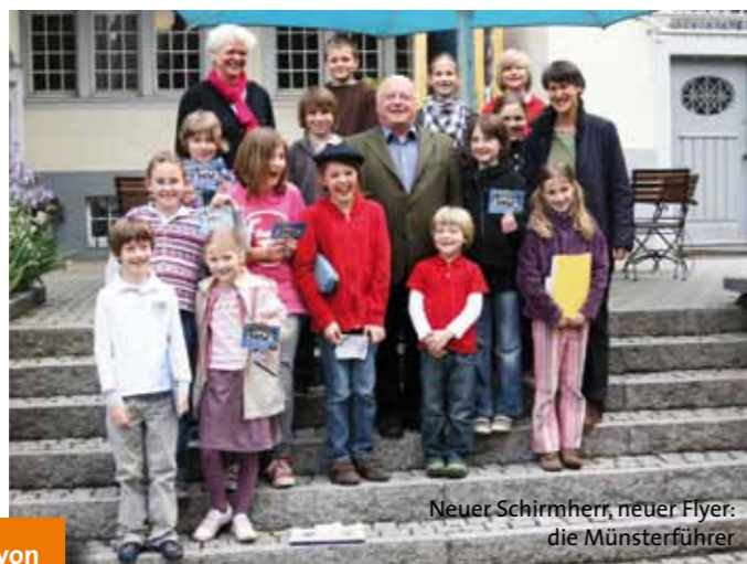
Neuer Schirmherr, neuer Flyer: die Münsterführer

„Geschichte erfährt man nicht aus Büchern – man muss sie erleben!“ – Norbert Blüm, neuerdings Schirmherr, ist von den Münsterführern begeistert. Bei seinem Besuch in der Grundschule des Montessori Zentrum ANGELL möchte er alles über die Führungen „von Kindern für Kinder“ wissen. Die Münster-Experten erzählen dem Freiburg-Liebhaber und Fan des SC ausführlich, was sie besonders am Münster fasziniert: Der Turm, durch den man hindurchgucken kann und die Fenster, die Geschichten erzäh-