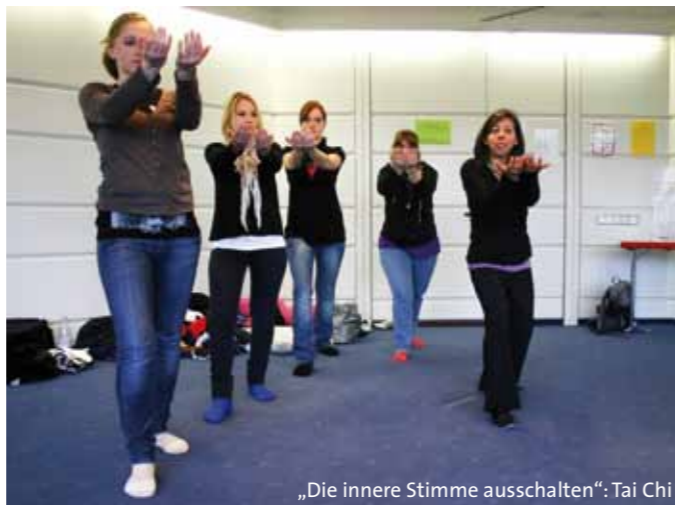
„Die innere Stimme ausschalten“: Tai Chi