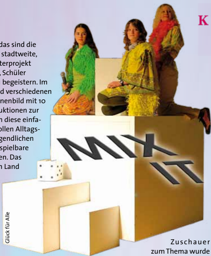
Glück für Alle

10 Würfel und Fantasie - das sind die Zutaten für „MIX IT“. Das stadtweite, schulübergreifende Theaterprojekt hat sich zum Ziel gesetzt, Schüler für das Theaterspielen zu begeistern. Im Rahmen von „MIX IT“ wird verschiedenen Schulen ein flexibles Bühnenbild mit 10 Würfeln für Theaterproduktionen zur Verfügung gestellt. Durch diese einfachen abstrakten Mittel sollen Alltagsräume der Kinder und Jugendlichen in neu erfahrbare und bespielbare Räume verwandelt werden. Das Projekt „MIX IT“ wird vom Land Baden-Württemberg und der Stadt Freiburg gefördert und ist Teilnehmer beim Wettbewerb „Kinder zum Olymp“ der Kulturstiftung der Länder. Die ANGELL-Produktionen entstanden in Kooperation mit PAN.OPTIKUM und dem Figurentheater Vagabündel und wurden von Sigrun Fritsch und Bernd Winter geleitet. Von der Grundschule bis zur Oberstufe wurden die Würfel von „MIX IT“ zum Spiel- und Theaterraum.