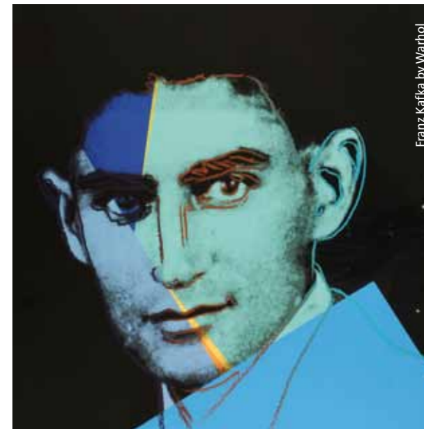
Franz Kafka by Warhol